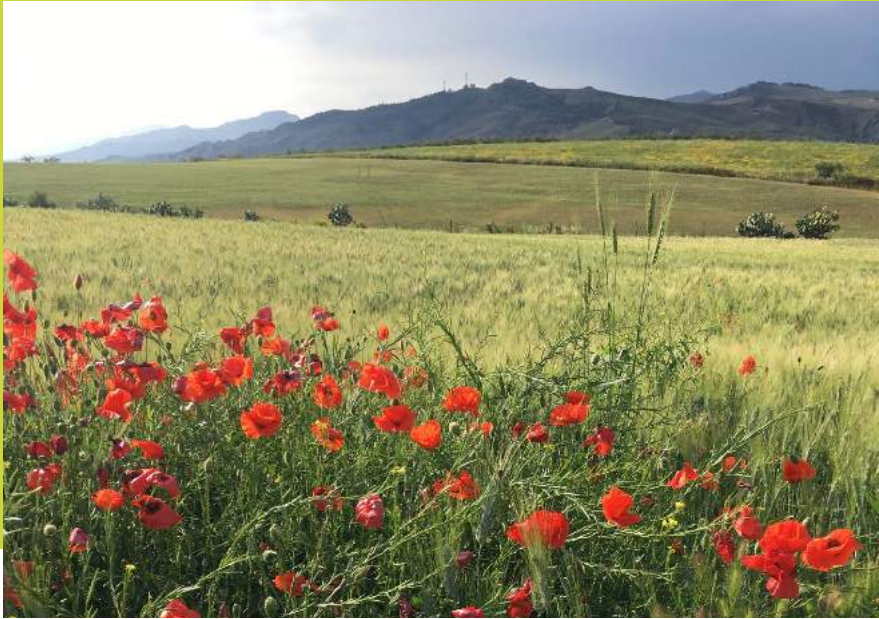
Vue depuis Mandre Rosse, mai 2022, Libertinia, Sicile

Un bulletin d'information à chaque livraison