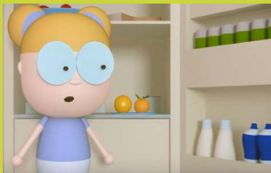
«Tra un'arancia e l'altra»