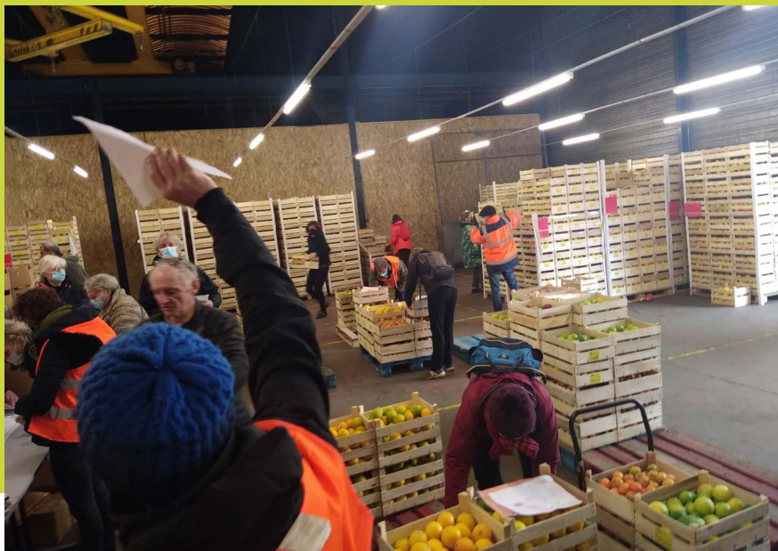
Ca s'active, ça s'active à l'entrepôt des Givrés !

Un bulletin d'information à chaque livraison